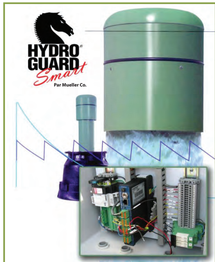
Dispositif Hydro-Guard MD S.M.A.R.T. MC HG-1