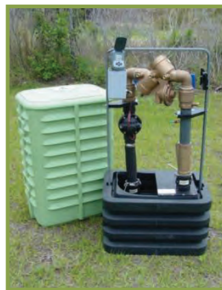
Dispositif Hydro-Guard MD S.M.A.R.T. MC HG-5