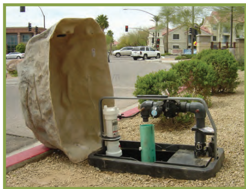
Dispositif Hydro-Guard MD S.M.A.R.T. MC HG-2 avec enceinte de pierre facultative