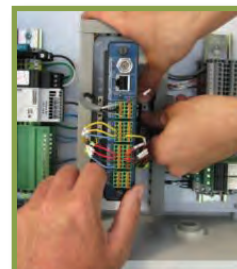
Wired for Management

Grâce à la communication bidirectionnelle, l'utilisateur peut recevoir une mise à jour en temps réel du dispositif Hydro-Guard doté du contrôleur S.M.A.R.T.