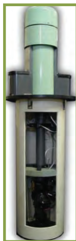
Dispositif Hydro-Guard MD S.M.A.R.T. MC HG-3